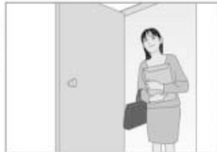
ご指定の日時に福利厚生制度受託会社（大同生命保険株式会社）の制度推進員が、アンケートとJタイプ（無配当重大疾病保障保険）のご案内にお伺いいたします