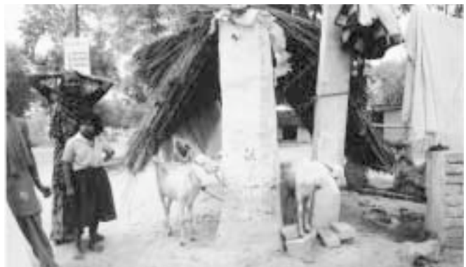
ベナレス貧しい農家