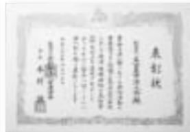
税法・税務研修参加率60%以上達成