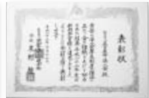
法人会福利厚生制度新規加入目標達成