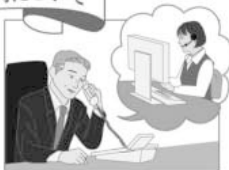
福利厚生制度受託会社（大同生命保険株式会社）のオペレーターが、予めご都合のよい日時をお伺いさせていただきます