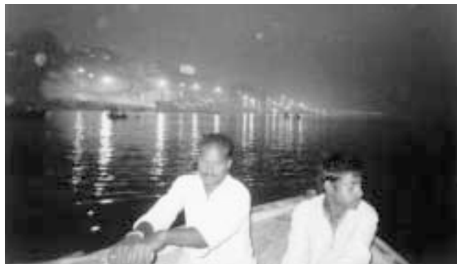
夜明けのガンジス川

インド人の80%が古くからのヒンドゥー教徒であり、以下イスラム教、キリスト教、シーク教、仏教、ジャイナ教、ゾロアスター教その他と続き、30くらいが主な宗教である。ついでに語ると、言語も30語くらい、そして教育と民主政治に必要な識字率は70%の低さといわれる。これで一つのインド