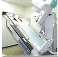
胃部 X 線撮影室