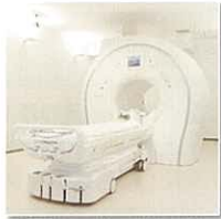
頭部 MRI/MRA 検査室