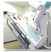
胃部 X 線撮影室