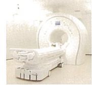
頭部 MRI/MRA 検査室