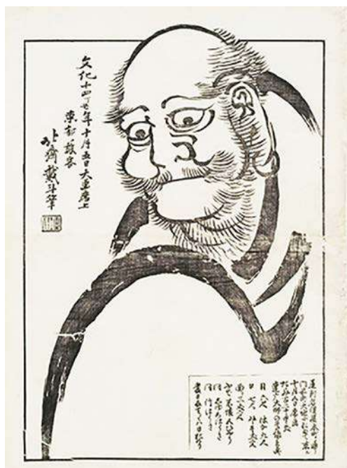
葛飾北斎「北斎大画即書引札」 名古屋市博物館蔵

百年余り後の葛飾北斎も、名古屋大好き文化人です。文化9年（1812）の秋、北斎は関西旅行の途次、南久屋（現在のラシック）門人・牧墨僊（まきぼくせん）宅に半年ほど滞在しました。その折、北斎が描いたという三百点余りの絵を、永楽屋東四郎（えいらくやとうしろう）が文化11年（1814）に出版したのが『北斎漫画』です。