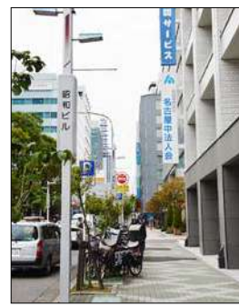
公益社団法人 名古屋中法人会事務局 昭和ビル3階