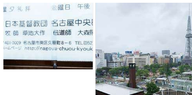
「久屋町」唯一の住居表示・名古屋中央教会（左） 中央教会から開発工事中の久屋大通公園を望む。緑の大樹がなくなり寂しくなりました。（2019年7月撮影）

江戸時代の町割りでは、久屋町は北の外堀通り1丁目から広小路に面する8丁目まで8ブロックありましたが、度重なる町名変更や道路建設のためなくなってしまいました。しかしながら、中区と東区の境となり、新しい住居表示からどういいうけか漏れた、南端の8丁目6番地・名古屋中央教会のみ一軒が久屋町の表示住所として現存しています。