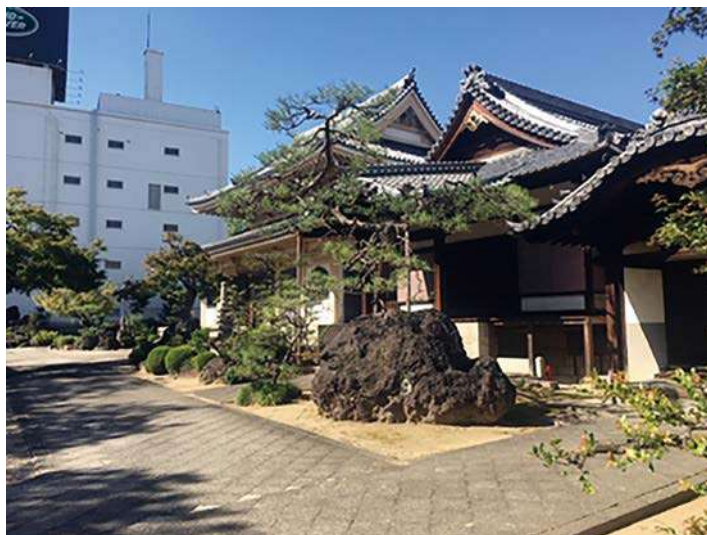
政秀寺：庫裏と本堂（栄3-34-23）