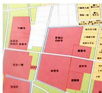
明治2年矢場町地図・南北に隣接する白林寺と政秀寺