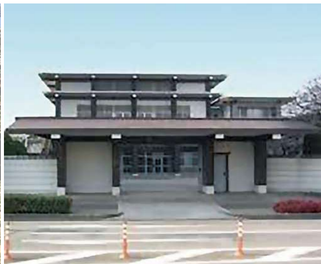
現在の法光寺：昭和区花見通2-3