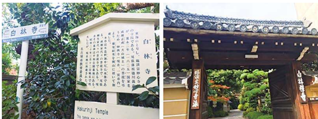
白林寺案内板と広小路散歩コース（左）白林寺山門（右）