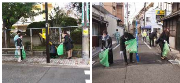
3コースに分かれ、ゴミを拾いながらパトロール