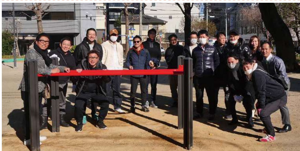
大須裏門前公園のまごころ遊具を前に青年部会の皆さん