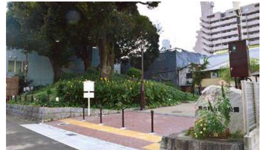
大須にある前方後円墳、2022年2月リニューアル開園