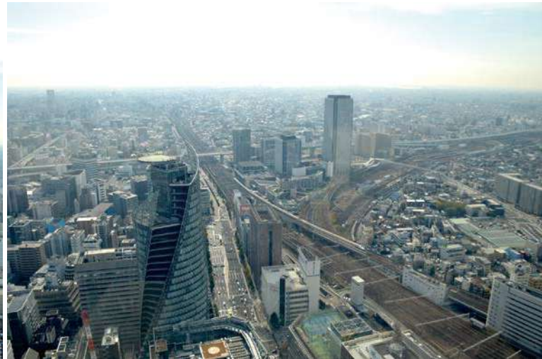
南方面 中央奥に名古屋港と伊勢湾 手前東海道新幹線