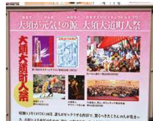
祭の歴史がわかるパネル 那古野山古墳（直径22m高さ3m）公園