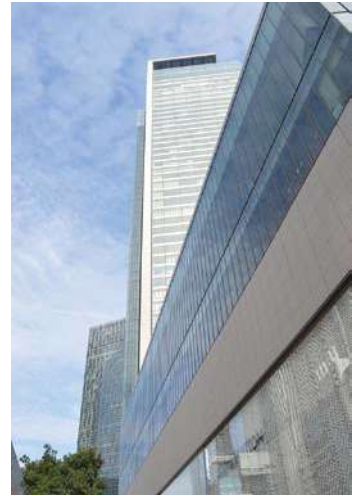
ミッドランドスクエア

42階の会場から、遠く東は東山スカイタワー、南は名古屋港と伊勢湾を望むことができます。眺めていると天竺に向かった西遊記の孫悟空の「きんとうん」に乗って飛んで行けるような素敵なパノラマでした。