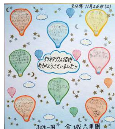
子どもたちからのお礼の色紙