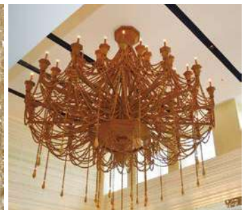
オリーブの木で造った シャンデリア