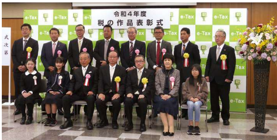
名古屋中法人会 女性部会「絵はがきコンクール」入賞者の皆さん

期間／令和4年11月11日(金)~17日(休) 会場／NHK名古屋放送センタービル1F