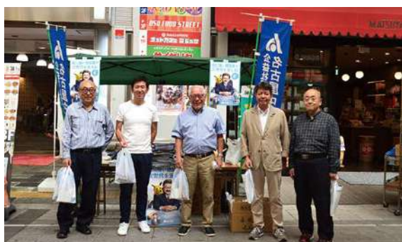
左から、今井、外薮一統、堀江、川口、鶴岡の各氏