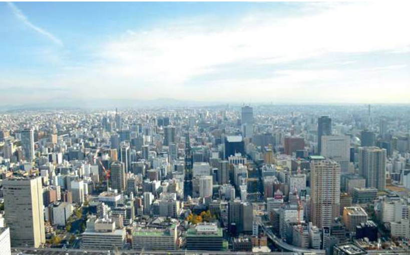
会場からの展望 東方面 中央右手に東山スカイタワー