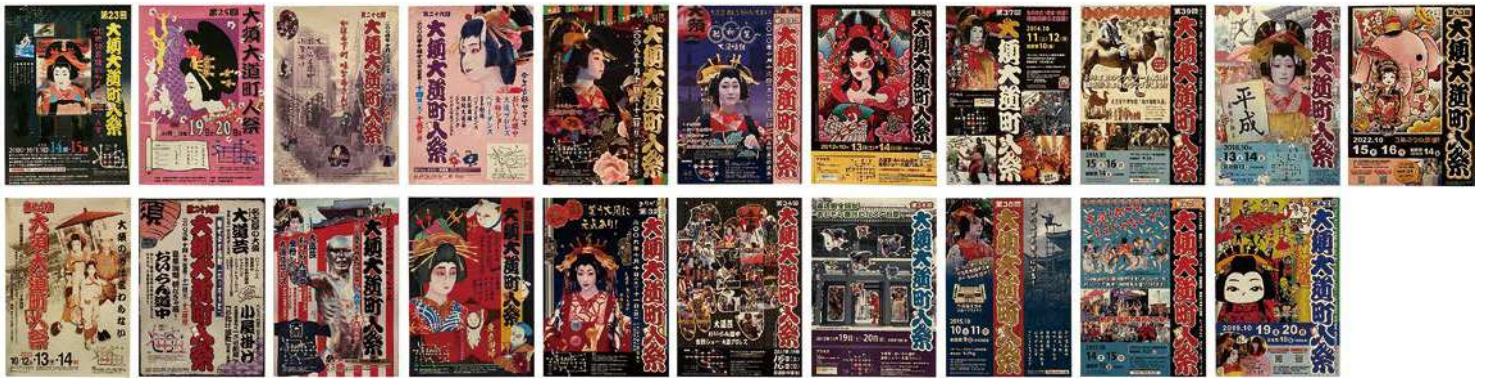
大須大道町人祭 歴代ポスター（大須掲示板より）