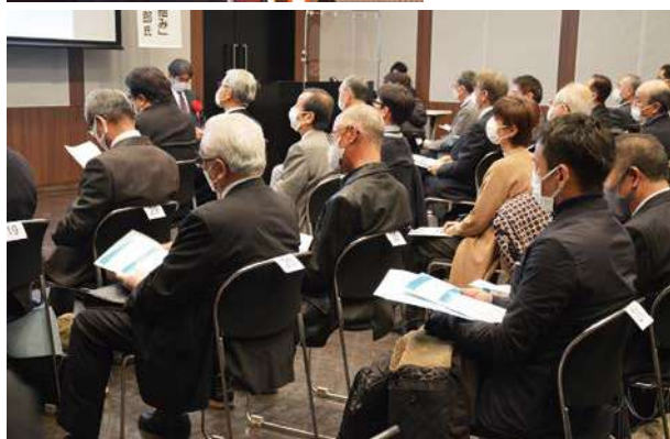
ウイंकあいち（愛知県産業労働センター）5F小ホール