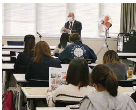
法人会入会のご案内 鶴岡専務理事