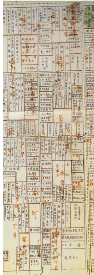
地図1：昭和34年の下長者町・住宅地図 住宅地図協会が昭和35年に発行

錦2丁目の活性化のために秋のえびす祭、あいちトリエンナーレ誘致、などいろいろなトライアルがされています。私が世話人の「名古屋の旧町名を復活させる会」とコラボして郷土の歴史を復活し、名古屋人が郷土に誇りを取り戻すことを目的に、町名復活を目的とした組織「『長者町』を復活させる有志の会」が2013年末に立ち上がりました。しかし、一部の賛同が得られなくなり、現在は、町名復活の活動が小休止しています。