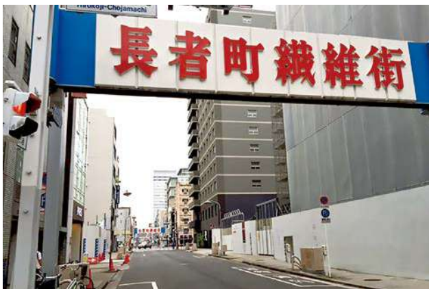
写真1：長者町繊維街の名物アーチ、広小路より北を望む各ブロックに設置

清須には富豪が集まり住んでいたところがあり、長者町と呼ばれていた。清須越し江戸時代の長者町は、大名が通る本町の裏通りとして、下級武士・荷役・商人・旅人が通るところであったか?? 同様に、第二次大戦後、本町通りは、広小路角の徴兵館ビルが進駐軍第5空軍司令部になり、名古屋城南の駐屯地からジープが轟音を立てて通る道となり、跋扈する米兵に恐れをなして、通行する人もまれな道路となってしまいました。一本西の長者町通りには雨後のタケノコのように、薄利多売・現金売りの日本有数の繊維問屋街となりました。(写真1)