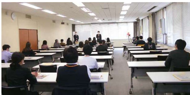
名古屋中税務署会議室

日時／令和4年11月10日(木) 13:30~ 会場／名古屋中税務署会議室 講師／名古屋中税務署担当官