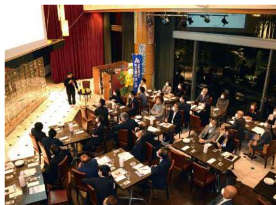
ウルフギャング・バック・レストランカフェ