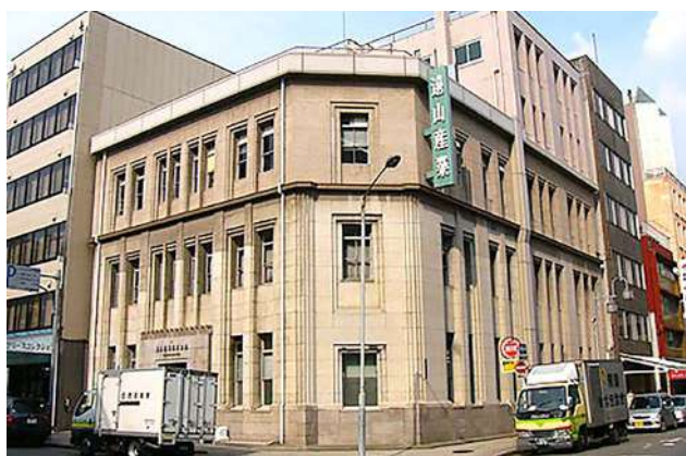
写真2：遠山産業ビル 昭和10年建設 戦後道路拡幅で引きづり工法で移動が話題