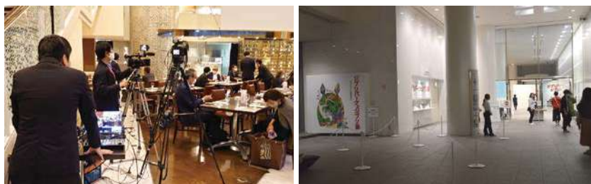
なごチューブ配信