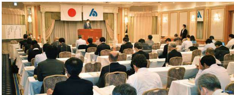
東京第一ホテル錦2Fプリランテ