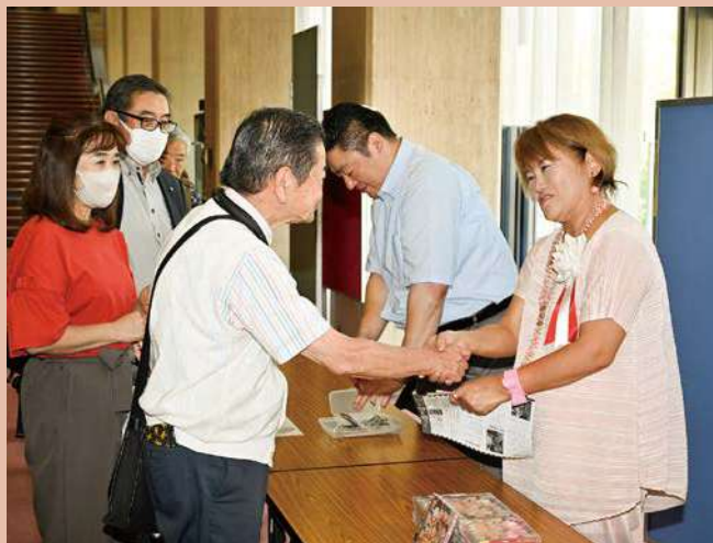
サイン入りのCDを求めるファン