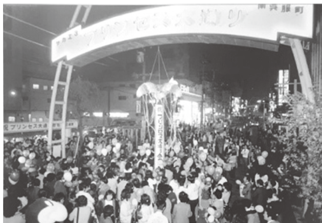
南呉服町通に「プリンセス大通り」の愛称が付けられ、盛大に開かれた命名お披露目式の様子。 昭和57年12月撮影