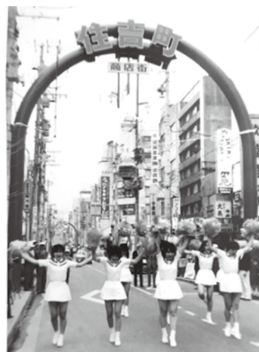
七間町通の住吉町でもアーチ型の街路灯が完成し、お披露目のパレード。栄の繁華街は年々、にぎやかさを増しました。 昭和60年4月撮影