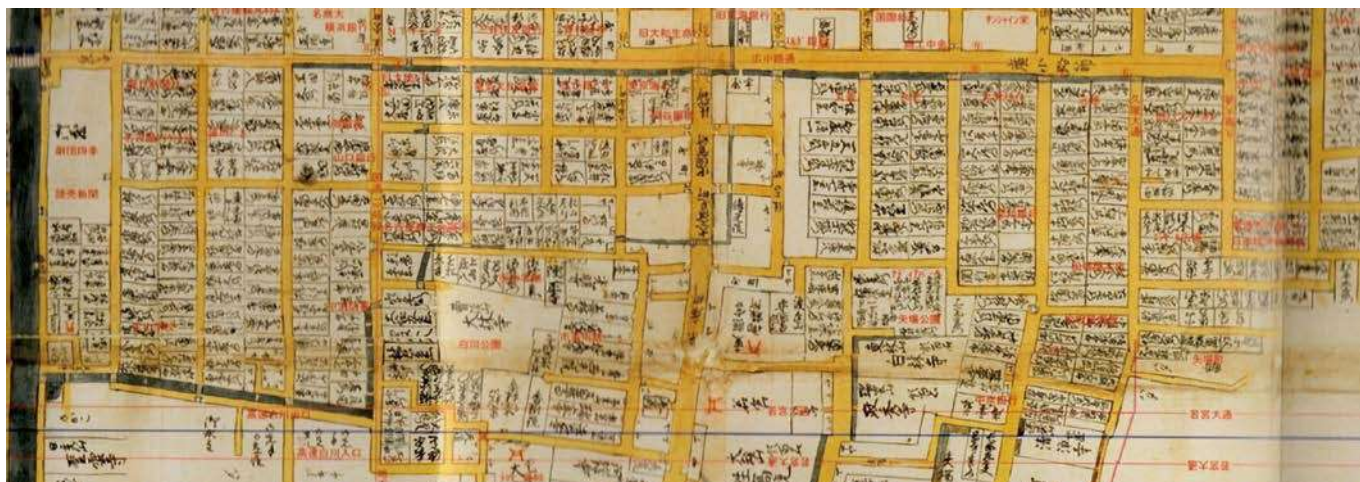
宝暦12年（1762）名護屋路見大図：現在の栄1～5丁目 左端が堀川、右端が武平町界限

「栄町」という町名が正式に成立したのは明治4年（1871）で、広小路長者町より栄町1丁目から南久屋が栄町7丁目となりました。江戸期から中下級武士の家屋が多く武家の没落とともに新しい店舗や銀行などが進出、その後、東海道線笹島駅オープンに伴い、名古屋電気鉄道（市電）が明治31年開通し、広小路が笹島（名古屋駅）と中央線千種駅につながりました。これにより官庁・金融街が集約され、南北の大津通に熱田と結ぶ市電が開設されました。