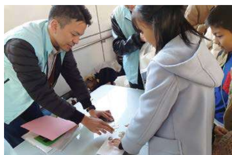
租税教室講師 河合統括官