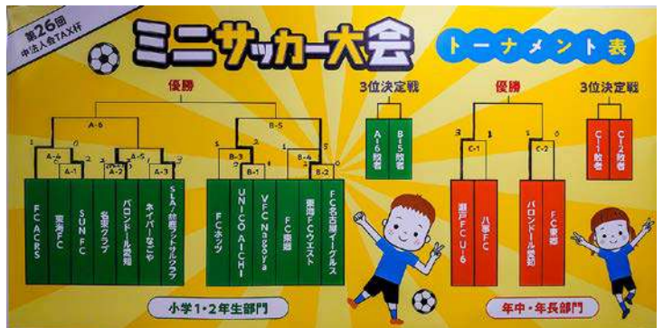
トーナメントパネル

年中・年少の部 小学1・2年生の部 優勝 バロンドール愛知 優勝 FCACRS 準優勝 瀬戸FC U-6 準優勝 UNICO AICHI 第三位 八事FC 第三位 鈴鹿フットサルクラブ