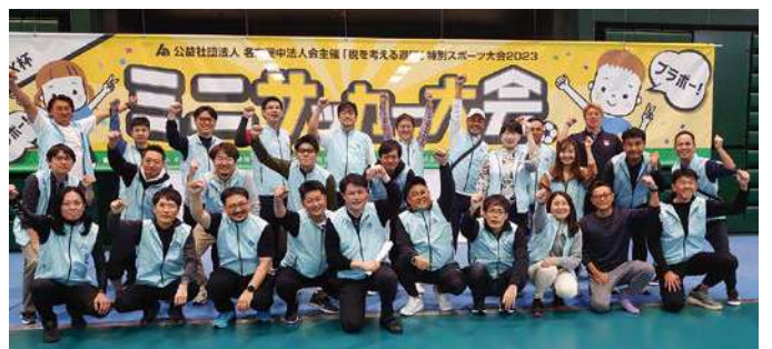
青年部会担当メンバー