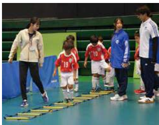
アトラクションコーナー 名古屋リゾート&スポーツ専門学校