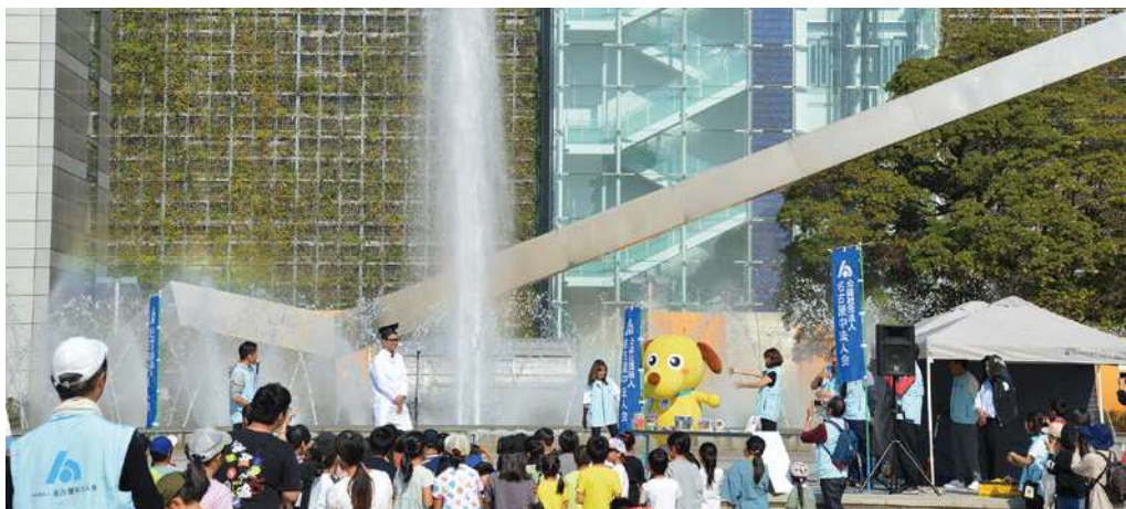
税金ウルトラクイズ