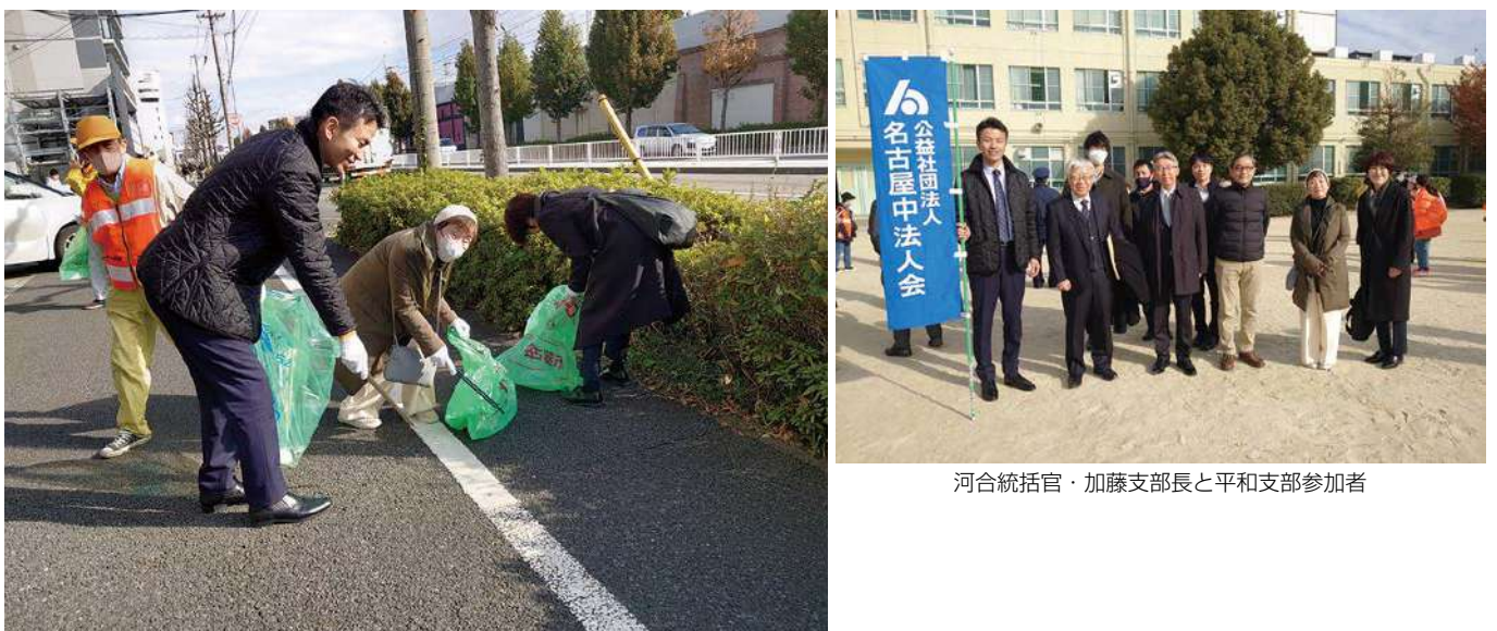
河合統括官も参加して清掃活動