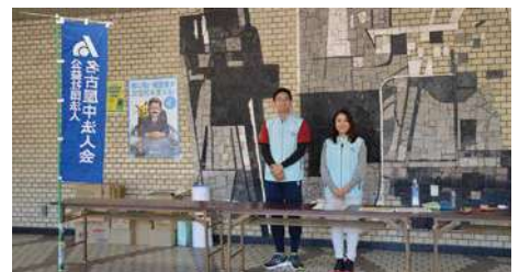
受付 青年部会スタッフ