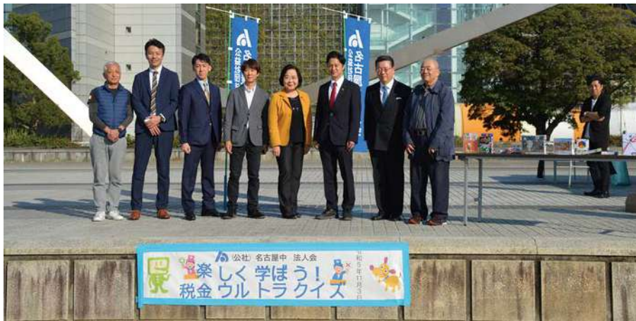
須田経営研究会代表幹事（左から4人目）と来賓及び主催者の皆さん