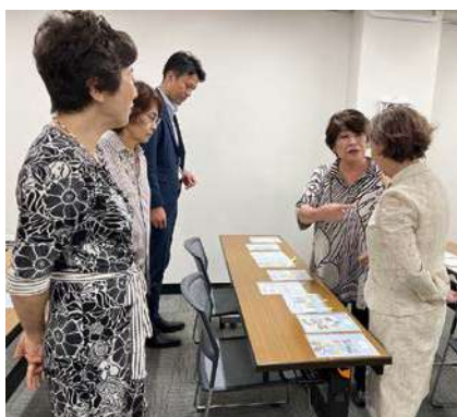
絵はがきの部作品審査風景 女性部会理事会 令和5年9月21日(休)