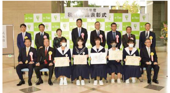
作文の部 記念写真