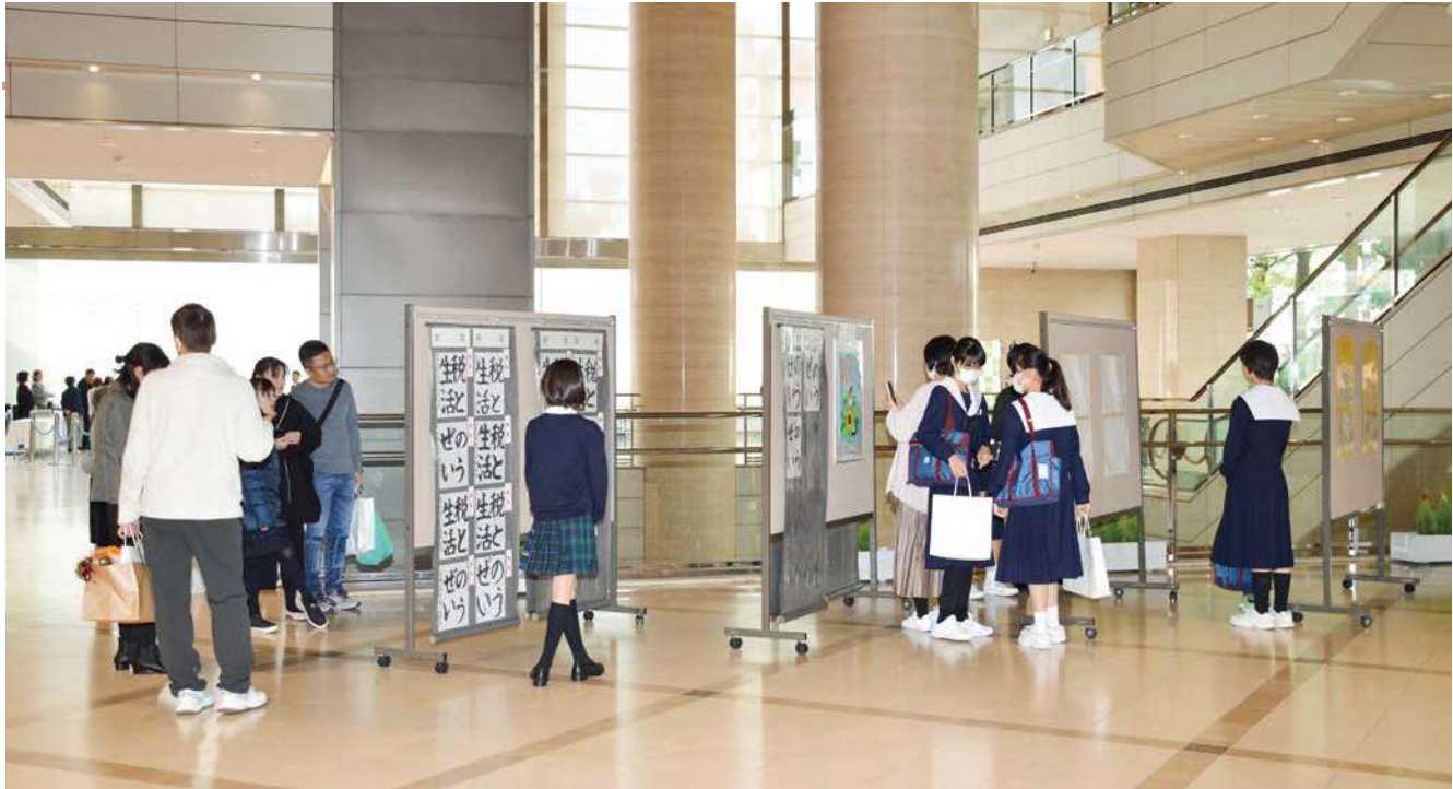
NHK名古屋放送センタービル1F