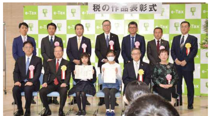
絵はがきの部 記念写真