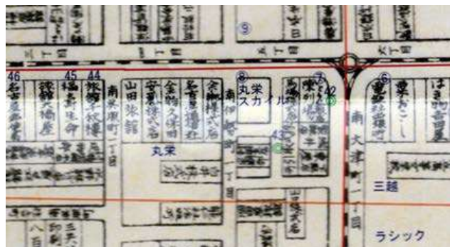
北見氏制作の地図より 明治42年広小路3～5丁目南呉服町を挟んで 西・旅館千秋楼（秋琴楼）、東・山田旅館

山田光成氏は戦時中に下呂温泉で旅館を取得、誘客のために後払い月賦の仕組みをスタートして、クレジットビジネスの嚆矢といえます。昭和23年（1948）41歳の時に、資