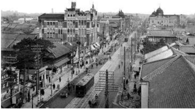
明治の広小路 西より東を望む： 秋琴楼(右下屋根)、山田旅館(右中央)、松坂屋(右奥)、朝日神社(左下)

もう一つは「秋琴楼事件」、詳しくは北見さんの『愛知千年企業〈明治時代編第1部 明治前期／1883(明治16年)〉』から引用転載させていただきます。