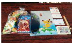
記念品とお菓子をプレゼント