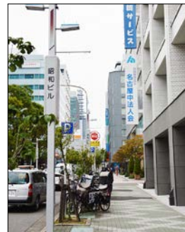
公益社団法人 名古屋中法人会事務局 昭和ビル3階