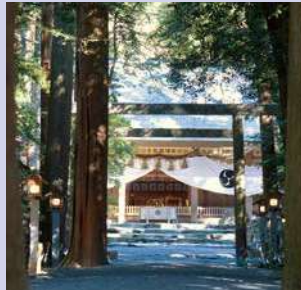
総櫓の神明造りの本殿 猿田彦大神を 松下電器（現 パナソニック）創業者 はじめ三十二神が祭られています。