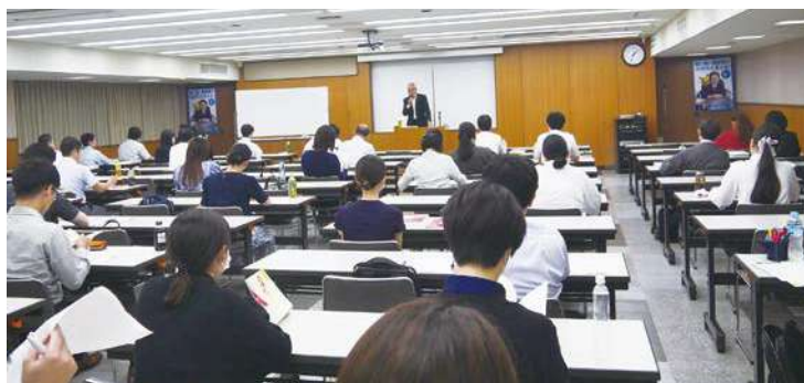
受講生59名の熱気で暑さ倍増