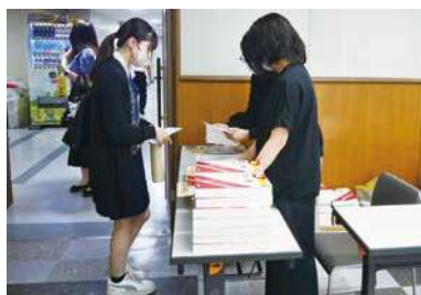
昭和ビル9Fホール受付