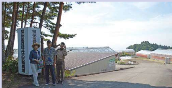
福花園西軽井沢試験農場