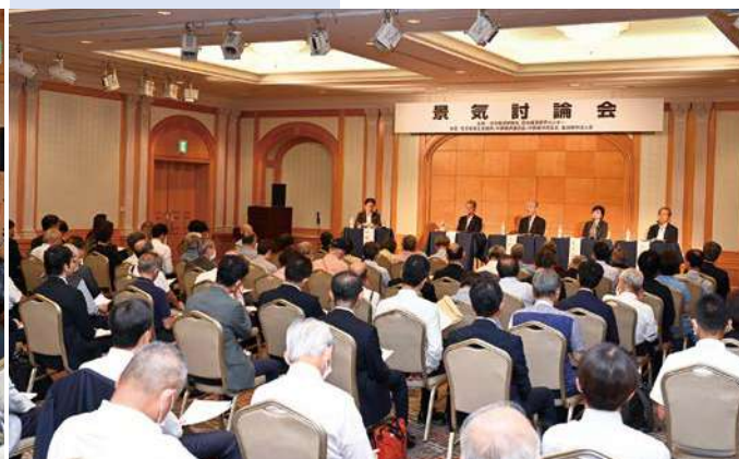
マリオットアソシアホテル16Fアイリスの間