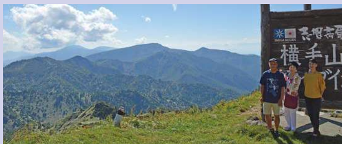
紅葉シーズン人気の志賀高原横手山ドライブイン