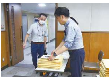
昭和ビル9Fホール受付