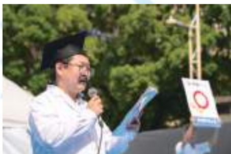
税金博士 名古屋中税務署 青山法人第一統括官