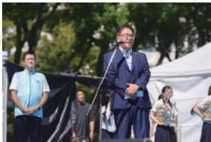
愛知県知事 大村秀章 氏

消防・警察・税務署などの協力を得て、職業体験や車両展示、ステージ企画を通じて、税金が公共サービスにどのように使われているかを楽しく学べる機会を提供しました。 また、体操やダンス、ブラインドサッカー、スナッグゴルフなどのスポーツイベントも実施し、スポーツを楽しみながら健康の大切さを感じていただく事業として、多くの方々にご参加いただきました。