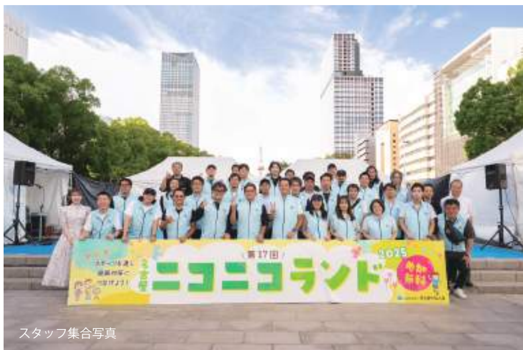
スタッフ集合写真